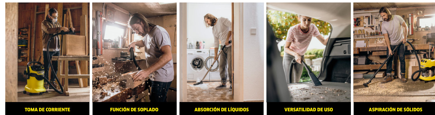
TOMA DE CORRIENTE